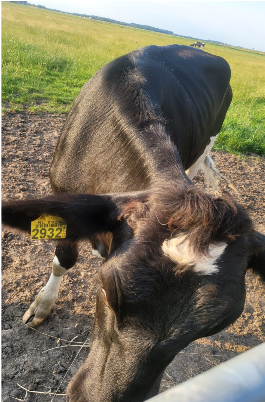
Deze sociale jonge dames kwamen ons meteen welkom heten bij het hek bij aankomst