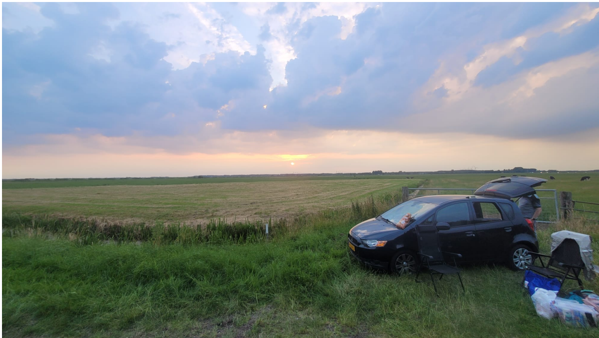
Deze foto werd in een andere richting genomen (west) maar ook hier op zien we de dreigende luchten ontstaan

nog maar halverwege het weggetje waren in onze richting. Dat was zonder twijfel de mooie grijsblauwe mercedes van Fred uit Alphen a/d Rijn en zijn navigator. En daarmee was nummer 5 ook binnen. Volgens de inmiddels verschenen deelnemers waren er wel een stuk of 8 teams onderweg dus wij verwachtten nog wel 3 auto's vanaf hier. Stilletjes hoopte ik dat dit niet te lang ging duren en had mij al voorgenomen (ook om de gezelligheid bij Pierre thuis niet te lang uit te stellen) tijdig hints te gaan geven zo dat het geen nachtwerk ging worden hier langs de A28. Maar de hoofdreden voor deze keuze was de lucht welke zowel in het zuidwesten als het noordoosten dezelfde vreemde kleur begon te krijgen als vorige week vrijdag in Lisse. En wat daarna kwam hebben we geweten (...). Schuilen onder het viaduct aan het begin van het weggetje was geen optie, want daar stonden palen. Nu had deze of gene die binnen was daar wel een oplossing voor maar daar ga ik hier nu niet verder op in. Ik wilde gewoon op tijd aan een broodje bal zitten en van het uitzicht op grote hoogte genieten. Zo vaak zie ik Pierre en Vera niet en ik heb er nooit een geheim van gemaakt dat ik het fijne mensen vind.