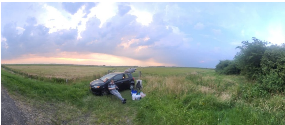
Moe. Ik heb door de hitte van voorgaande week geen oog dicht gedaan 's nachts