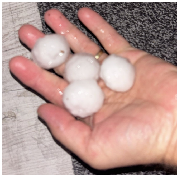
Niets is overdreven hoor

Namens de Streekvos tot a.s. vrijdag, want dan is Streekvos 24 alweer in het verschied.