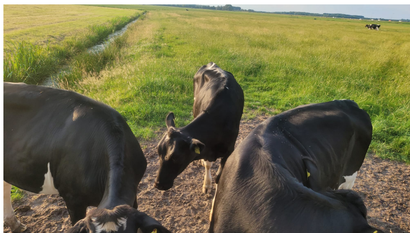
Hoe zou het voor deze meiden zijn als er onweer nadert. Ze hadden vast een plan...