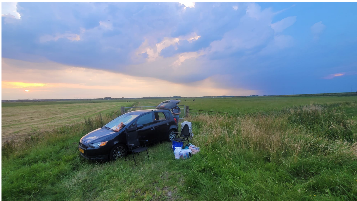
Ook in deze derde richting de dreigende luchten, dus ik werd langzaam onrustig en begon tips te geven...

Het werd tijd om een tip te geven en ik begon met de vertellen dat de deelnemers in de buurt van Nijkerk moesten zijn (dat was hemelsbreed amper 300 meter verder op, maar wel aan de andere zijde van de A28. Die Spookrijder (Collin) wist te melden dat hij daar werkt in dat industrieterrein en er dan ook aan het zoeken was een tijdje... Nee Collin, verkeerde kant van de snelweg! Dat was dan ook mijn volgende tip geweest, want die luidde: 'We staan vlakbij Nijkerk maar niet er in! Kom naar de N301 naast Nijkerk, dus aan de andere kant en kijk om je heen'.