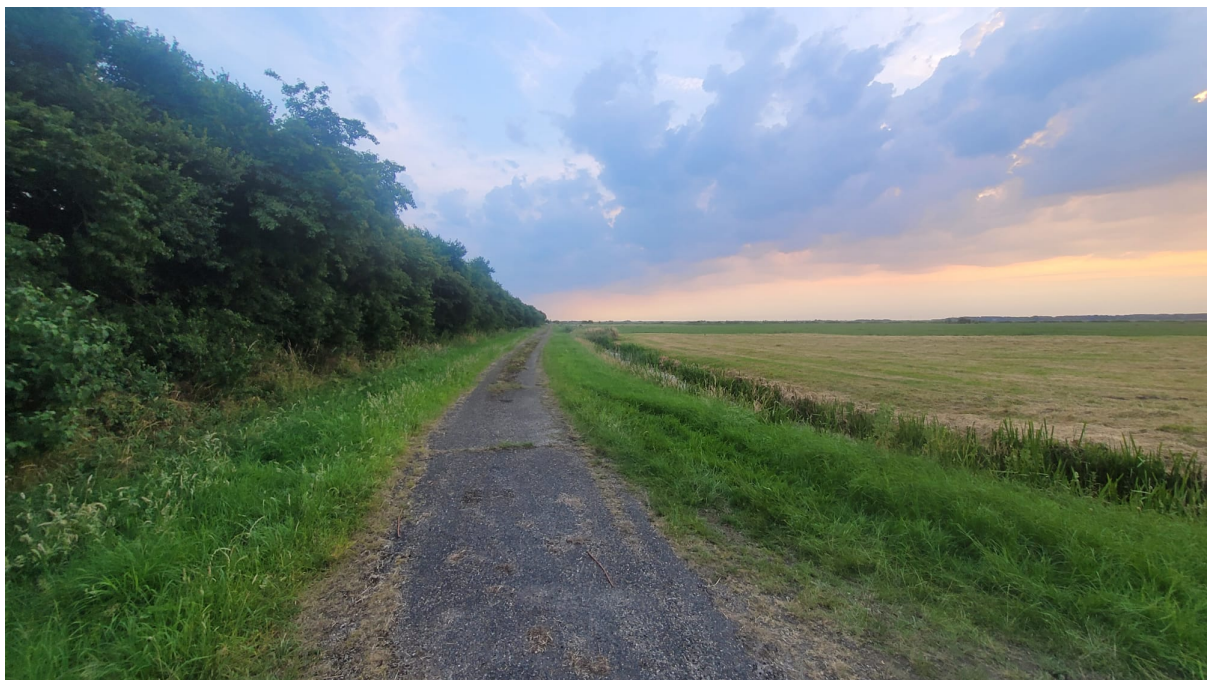
Het bijna vervallen weggetje werd al donkerder toen we nog minstens 3 auto's verwachtten...