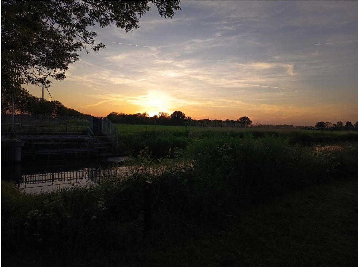
Het uitzicht bij de zonsondergang was ook deze avond weer adembenemend mooi