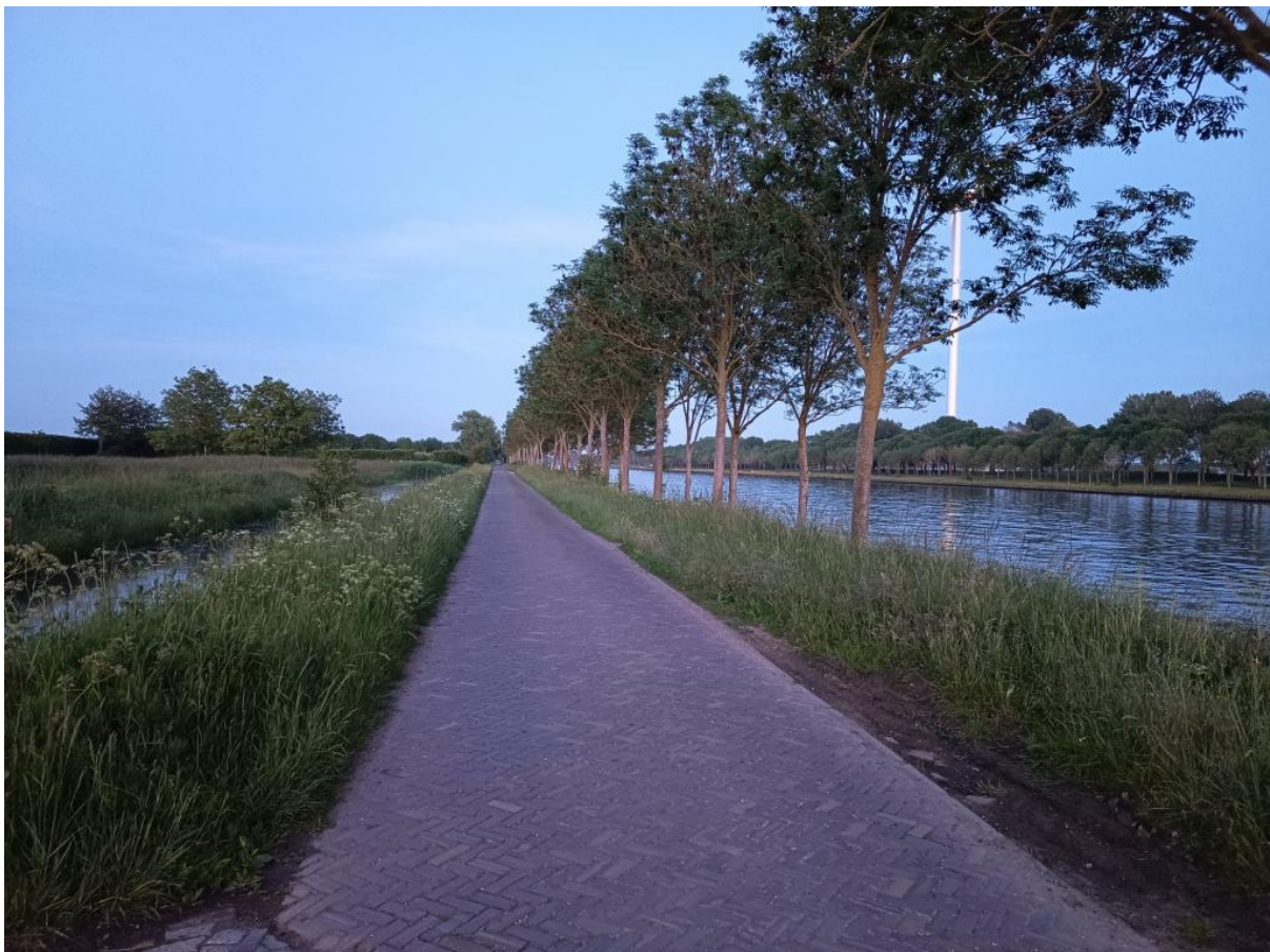
Slechts één smal dijkje naar links of rechts gaf toegang tot deze Streekvos locatie