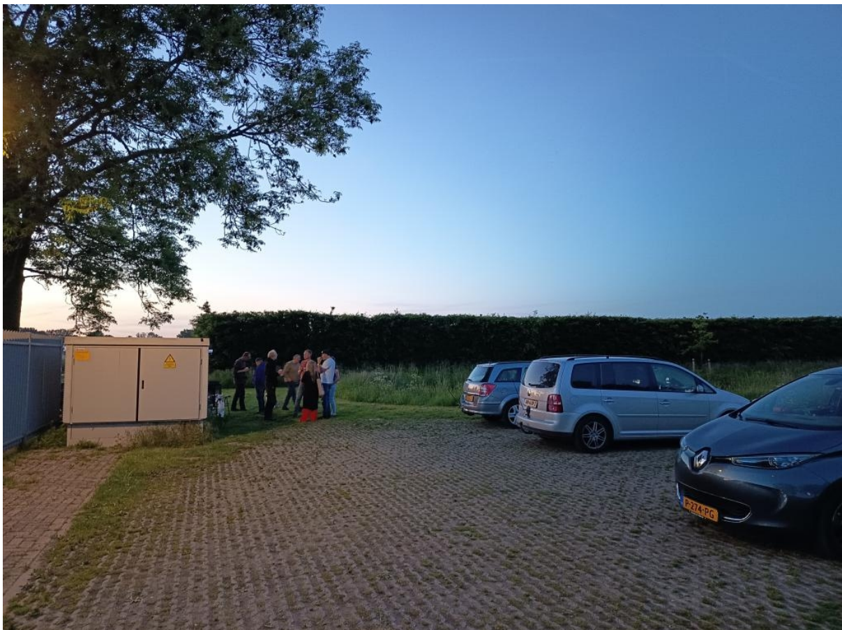
Je ziet de zwarte 'nieuwe' Streekvosauto vanaf de weg niet staan achter het stroomhuisje voor het gemaal