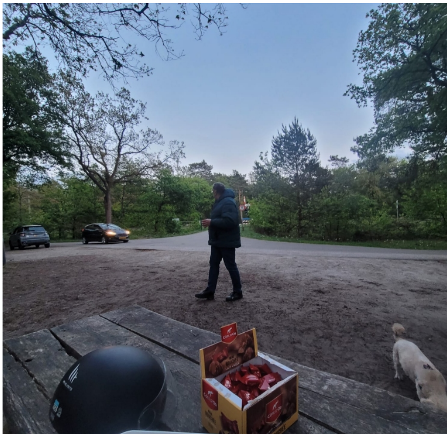
Links bovenin zien we team Spookrijker Jr. verschijnen. Rechtsonder het hondje van team ATV

Toen er later een heel klein en mooi vogeltje passeerde boven ons hoofd, ging de jongedame van de twee die geruime tijd met ons gesproken hadden en Rob's diensten hadden aanvaard, mij vertellen dat het waarschijnlijk een Boomklevertje was geweest. Ik heb wel iets met vogels en kan dat wel aanvaarden, maar zeker wisten we het natuurlijk niet.