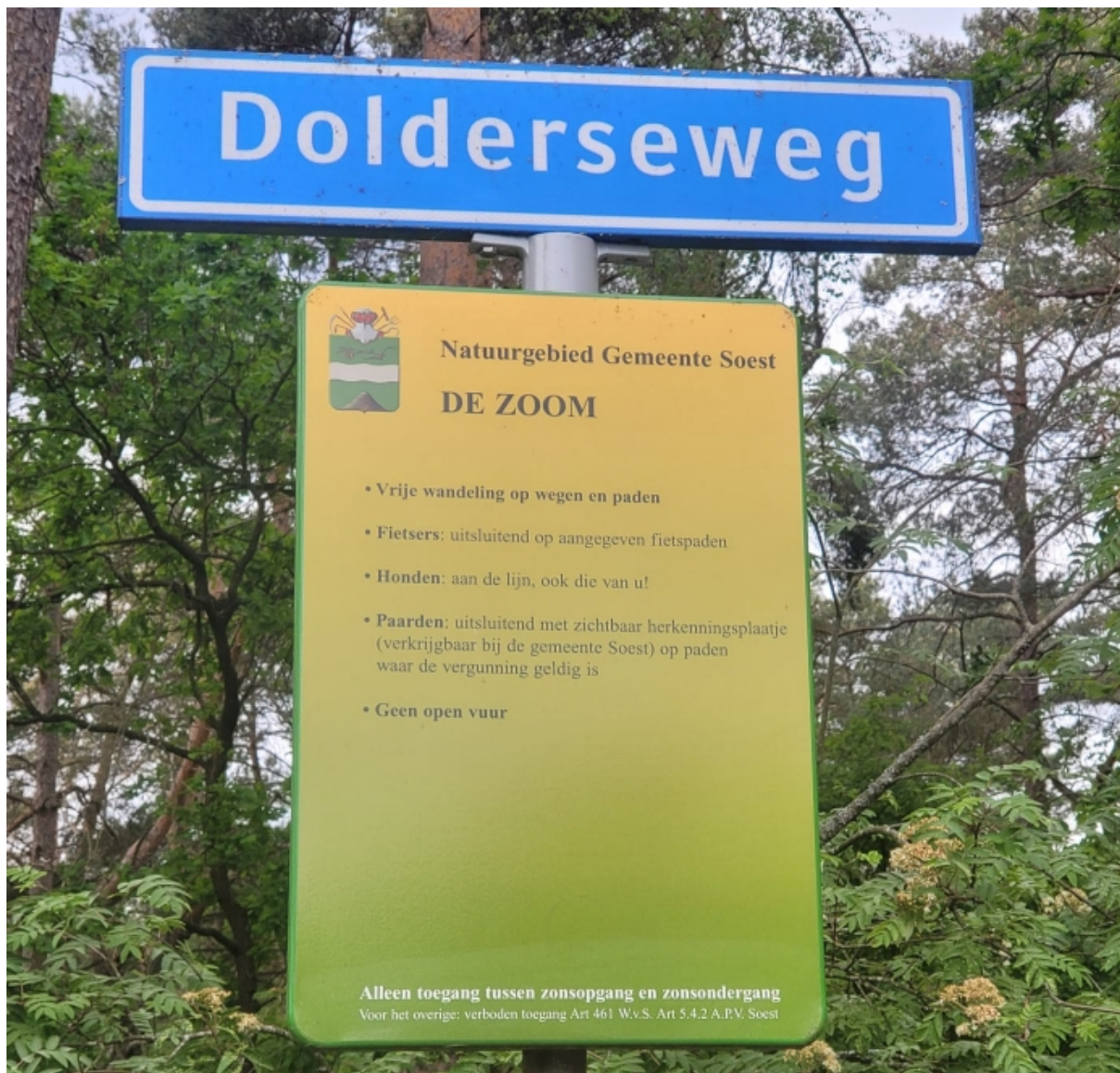
Gemeente Soest laat hier geen misverstanden bestaan. Al stond het bordje nogal onopvallend aan de zijkant van de picknickplaats