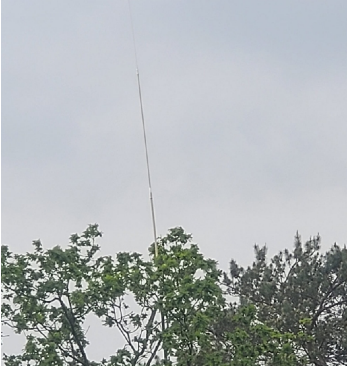
Hij hoefde van mij de boom niet helemaal uit. We waren toch wel hard zat (S6 langs de A12 met 9 watt...)