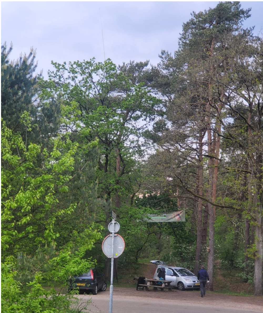
Recht boven de paal met het bekende verbodsbord zie je de antenne uit de boom steken

Soms heb je van die avonden dat echt alles anders lijkt te gaan en bij mij is dat meestal in de negatieve zin geweest terugkijkend op mijn leven tot nu toe, maar op vrijdagavond 8 mei 2026 was dat zeker niet het geval met Streekvos 2.0 editie nr. 19. Deze avond verliep van begin tot eind positief, echter wel met een hele vervelende angel ergens in het midden. Dat betrof een telefoontje van onze enthousiaste en gemoedelijke Streekvos vriend Mitch uit Hoofddorp. Die belde mij dat hij rijdende was maar zijn zoektocht moest onderbreken. Hij had verontrustend nieuws vanuit het thuisfront ontvangen en moest onmiddellijk naar huis terug keren. Dus wenste ik hem sterkte en een veilige terugreis. Verder moeten we het even afwachten hoe dit verder zal gaan. Tot zo ver de angel en dan volgt nu het positieve verhaal.