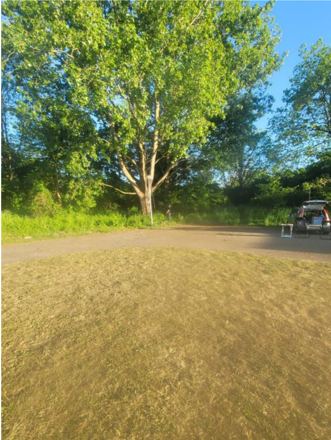
Dit is de enorme boom waar de 20 meter hoge zendmast in stond (de auto is daarna verplaatst ri. Boom)