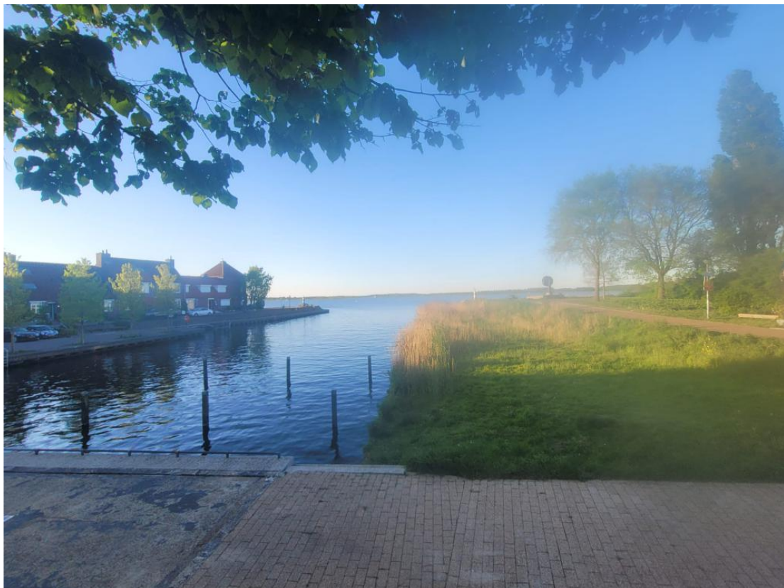
Het uitzicht op het Gooimeer ri. Almere Haven