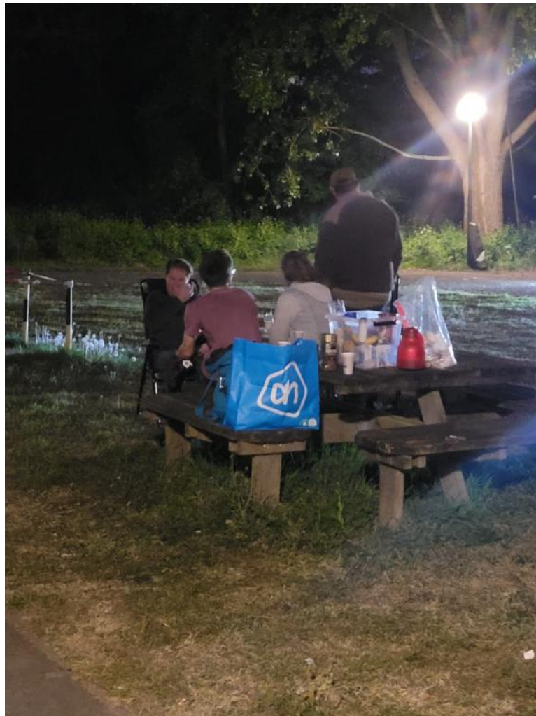
Handig die vele picknickbanken daar in Huizen op de Kooizand