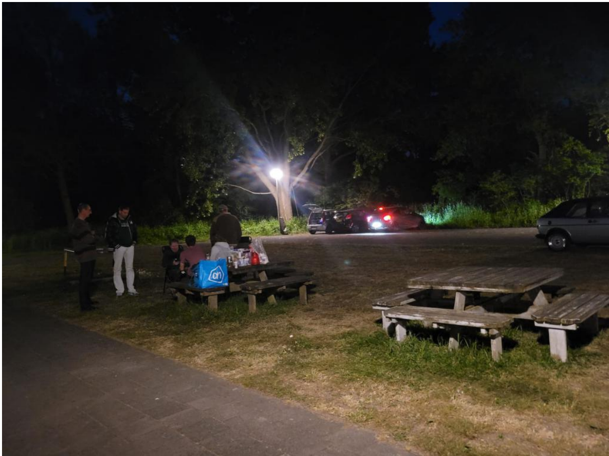
Daar in de hoek (achteraan links) de Streekvos auto (met open klep). Geluid stond keihard en toch heb ik een roeper gemist zo vernam ik later.

Het liep lekker met het aantal deelnemers, want waren we vorige keer al na 3 deelnemers klaar (gek hè met een mini mastje achter een betonnen bouwwerk) hadden we deze keer al vroeg in de avond de eerste 5 auto's voor ons staan. Ja ik zeg eerste 5 want het aantal bleek rond 22:30u al bijna te zijn verdubbeld tot 9 auto's. En ik had nog heel bescheiden aan het begin van de avond aan de zwemmers verteld dat wij er wel eens wat meer krijgen maar meestal 5 of zo... Dat was dus uitgerekend vanavond 'ietsje meer' en ook weer deelnemers die niet vaak bij ons binnen rijden. Dat maakt het dan nog leuker natuurlijk. Nu kan ik met trots en zekerheid zeggen dat we – minimaal - 25 teams hebben binnen gehad sinds de herstart in augustus 2025 (dat 'waarschijnlijk' kan ik nu gerust weg laten...). En dat voor een sirene uit een speakertje en een kop koffie, thee of chocomel met een chocolade biscuit (...). Ik blijf het wonderbaarlijk vinden... trouwens ook van mezelf dat ik het leuk blijf vinden om geld en energie te investeren in deze gekte. Tja, sommige mensen hebben een hobby (...) 😊