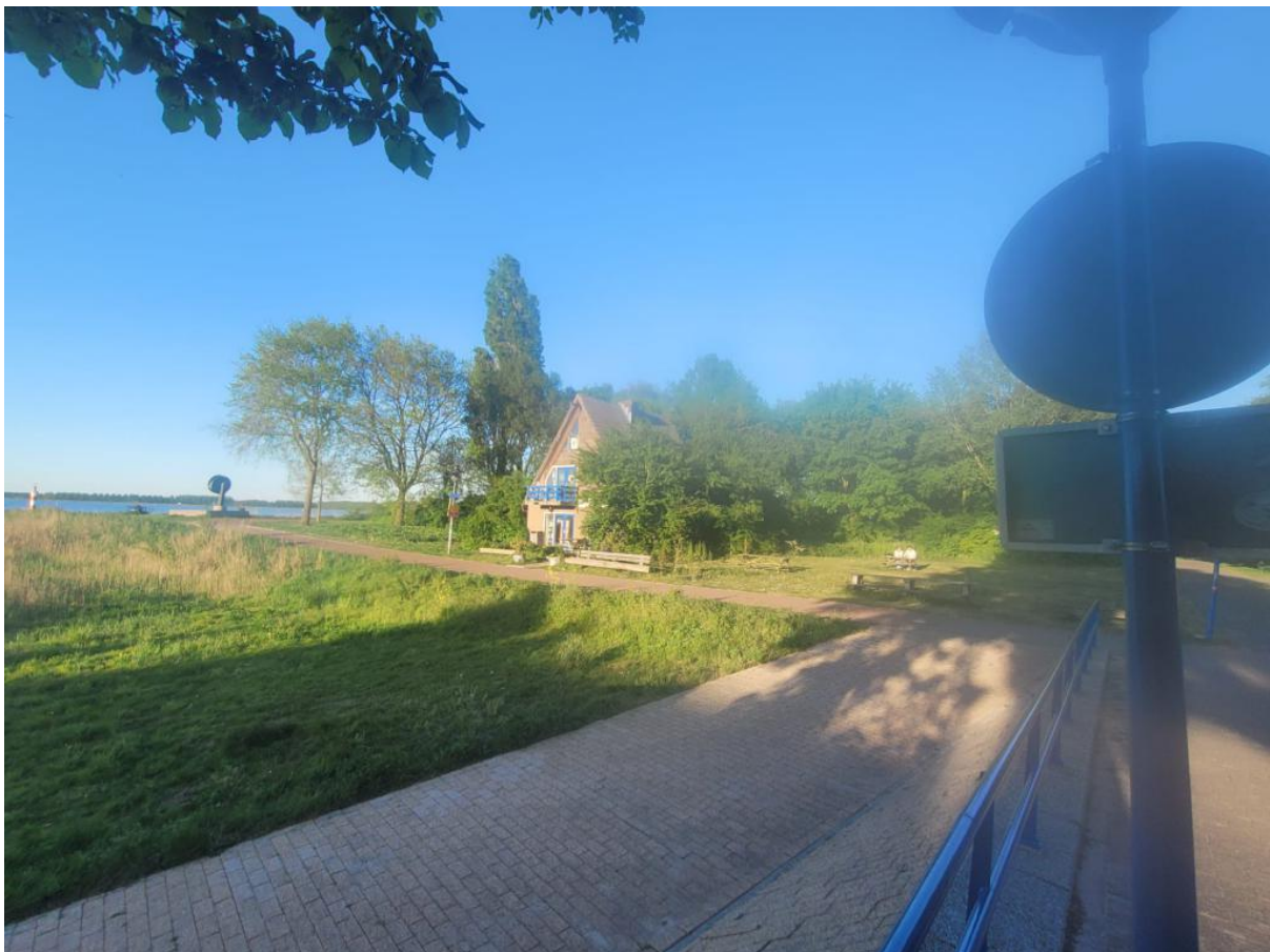
Stichting Varen en Zeilen is daar in dat huis gevestigd en vormde het baken in de Google navigatie in auto's. Hierdoor kwamen sommigen over het fietspad wat er voor langs loopt langs het water.