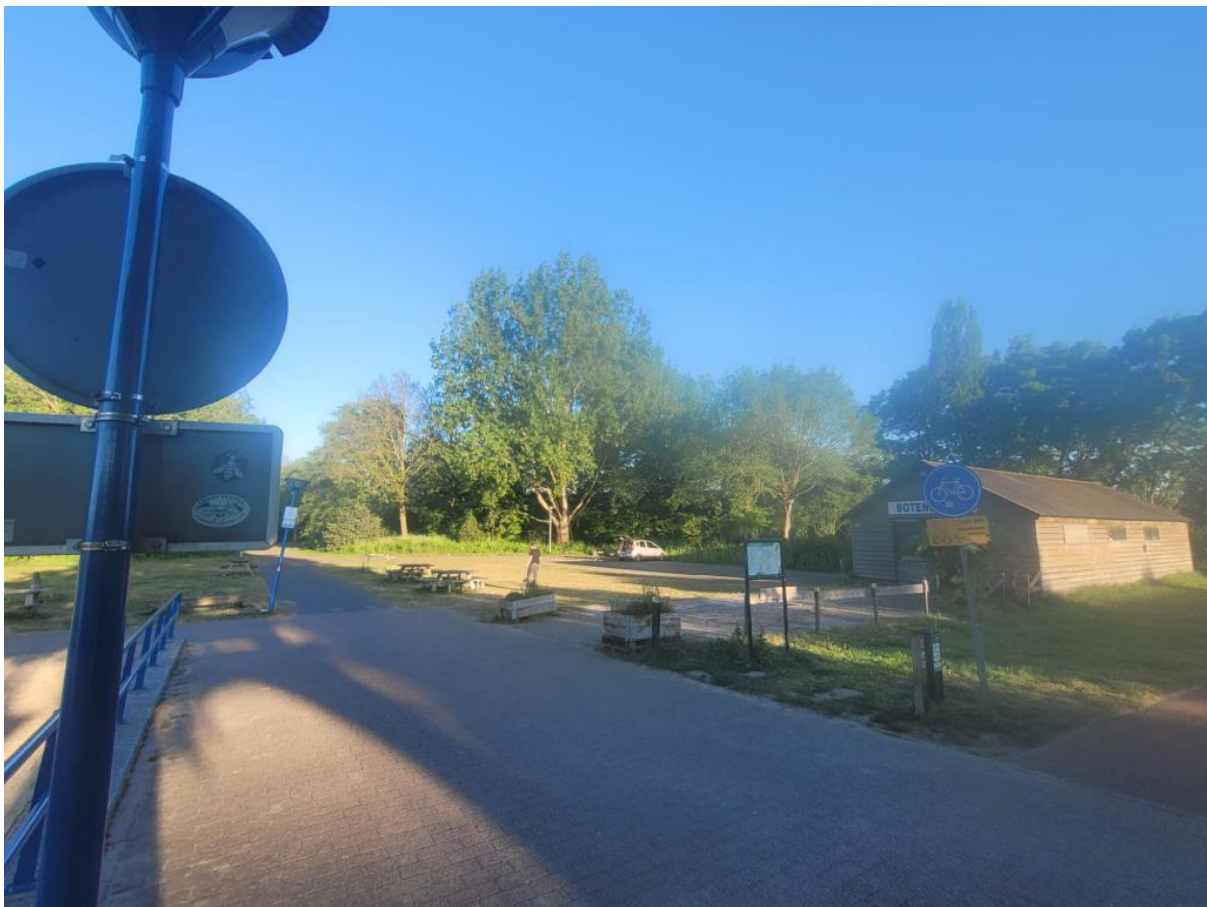
De plek was een plaatje