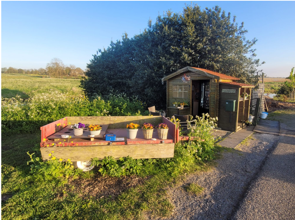
Het prachtige mini boerderij winkeltje van de vriendelijke eigenaars

Ik hoor net een stemmetje in mijn hoofd fluisteren: 'Jij schaamt je tegenover je deelnemers, maar vooral tegenover jezelf omdat je nu doet wat je anderen in het verleden diverse keren verweten hebt. Je als een Peppie & Kokkie radiovos gedragen! Dus wat ga jij komende vrijdagavond doen en waar ga je komende week al heel goed over nadenken? Dat je dicht bij het draaipunt in Baarn gaat staan en een (veuuuulllll) hogere mast gaat neer zetten, dus waar je dat kunt en gaat doen. Dit is zwaar onder jouw niveau kleuter!').