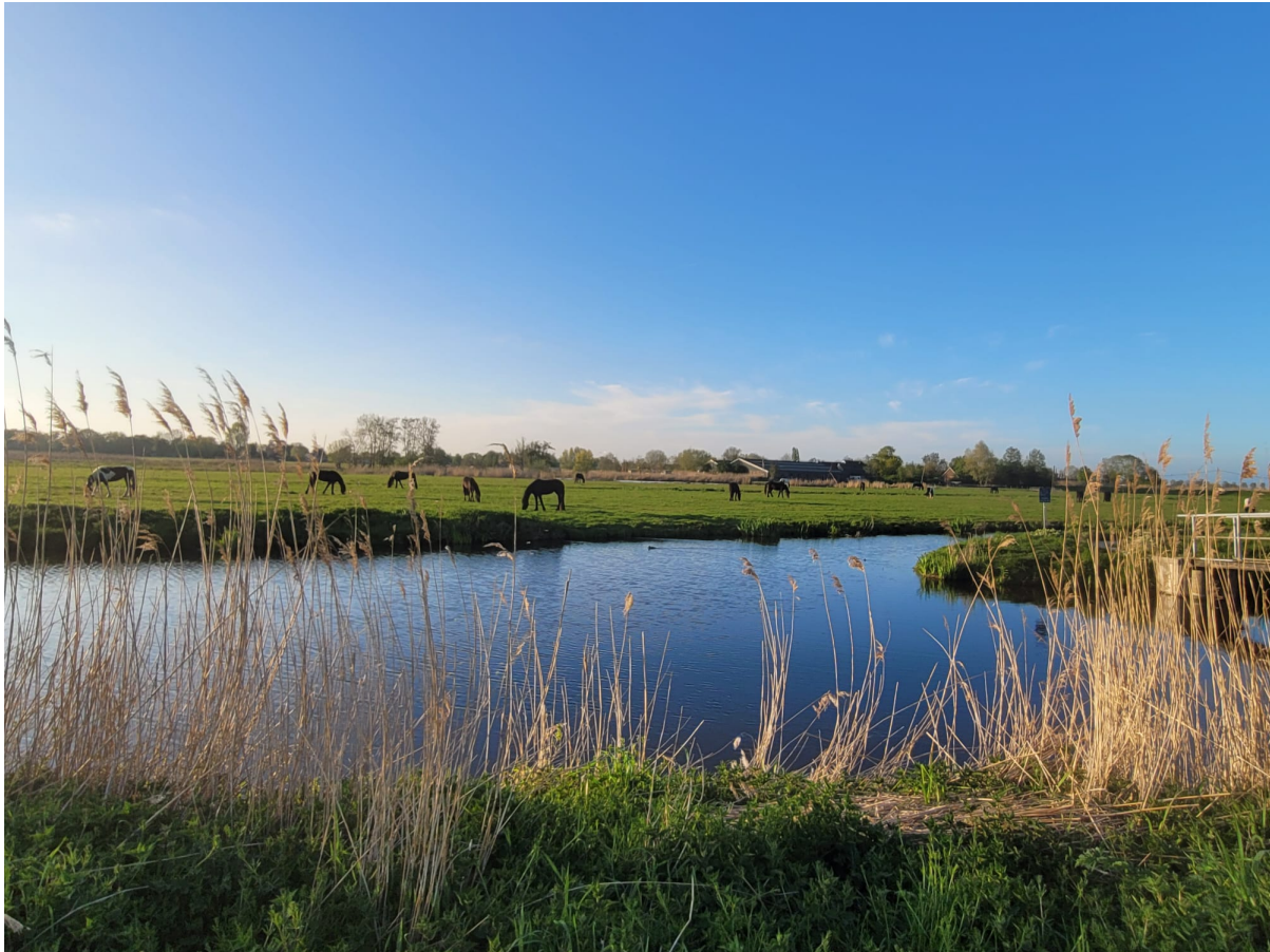
Deze prachtige paarden kregen het aan de stok met mijnheer Zwaan wiens vrouwtje heilig voor hem is