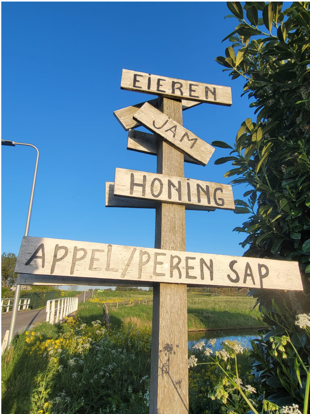
Er waren nog veel meer verse streekproducten te koop dan op deze paal te lezen staat

Het betrof hier een boerderij welke een flink stuk van de dijk af gelegen was met een lange laan er naartoe. En aan het begin hiervan aan de dijk stond een kippenhok waar 1 (ren)kip buiten liep en een grote haan met nog 3 kippen luid riep te kraaien. Het hok was omringt door mooie planten,