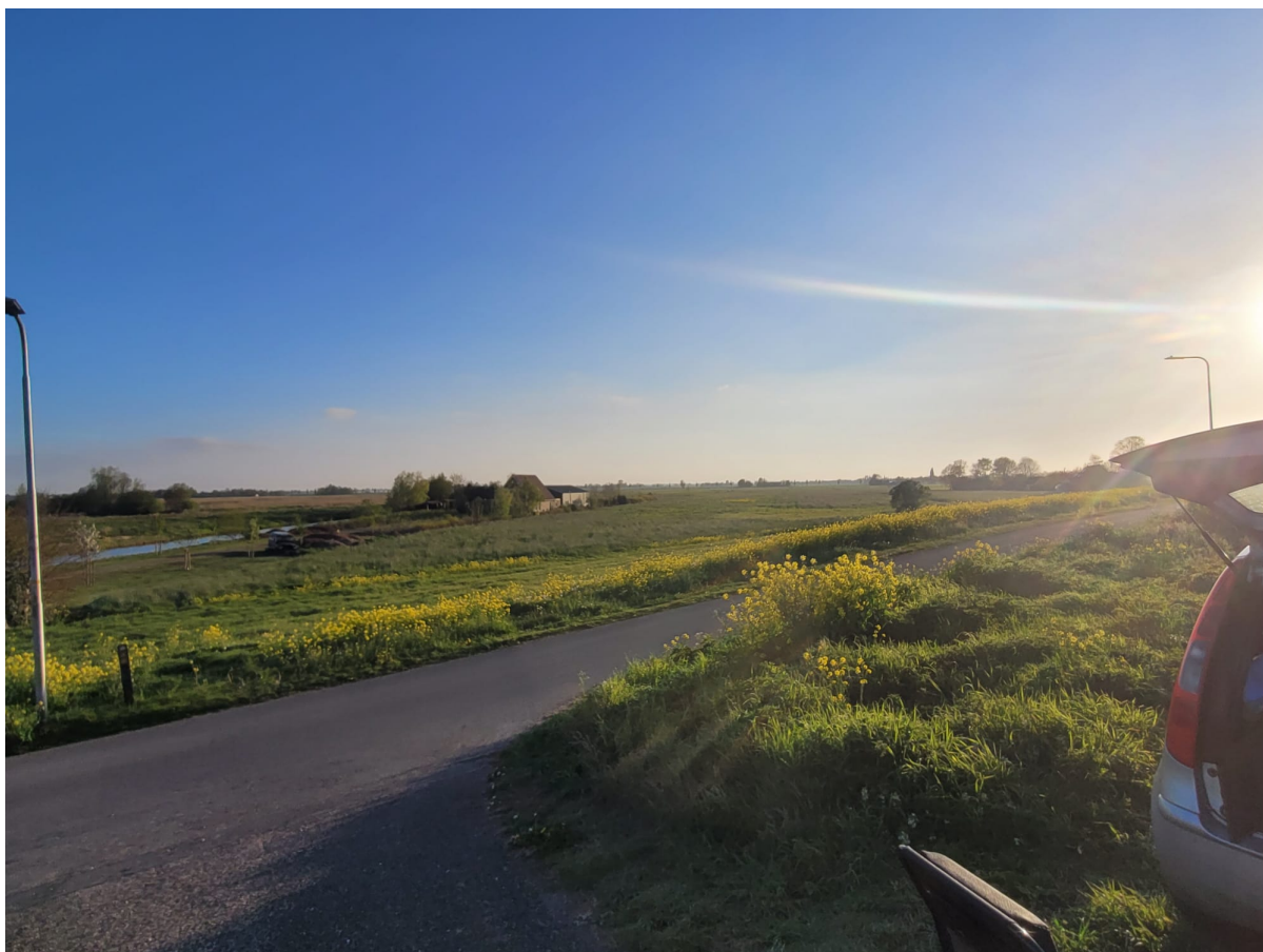
Pal aan de doorgaande weg. Maar wel een hele stille en in een (hele mooie rustige) uithoek gelegen

Ach ja, je leest wel dat het ondanks het koude noorderwindje wat volgens het KNMI er helemaal niet was... toch weer reuze gezellig was. En daar heb je geen 10 of meer binnenkomende auto's voor nodig. Tenminste de Streekvos heeft dat niet nodig, want die is zo gek dat het voor 3 telt en dan heb je evengoed een hele gezellige groep (...). En voor de overige zorgen de mensen uit de buurt hè 😊