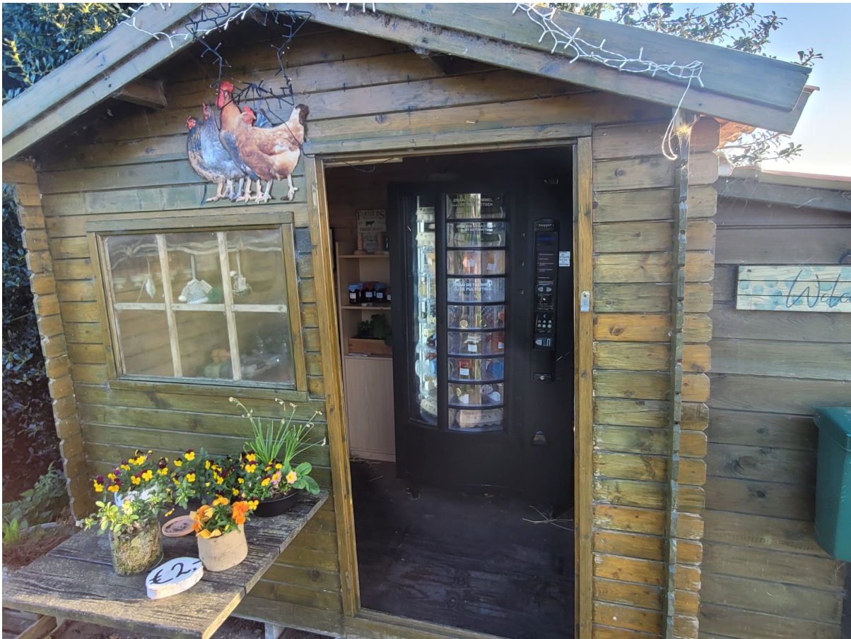
Een prachtig winkeltje met karakter

winter' aan de kanaaldijk bij Wijk bij Duurstede een aantal Streekvossen terug. Maar toen regende het er ook nog een partij bij en stonden we in de sappige bagger ook en dat was nu allemaal niet gelukkig.