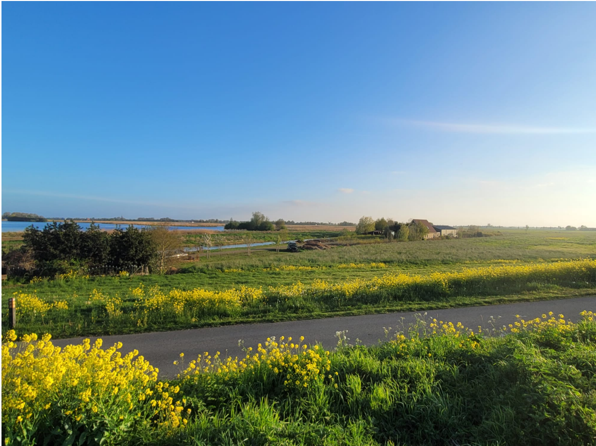
Natuurgebied en vogelreservaat 'De Groene Jonker' met de boerderij van de streekproducten verkopers er midden in

Een tiental minuten later was er weer activiteit maar nu aan onze zijde van de Kromme Mijdrecht en ik vroeg aan onze bezoeker die in de omgeving woonde of ik het goed begrepen had dat het daar dood loopt en dat er geen bruggen in de buurt zijn. De bezoeker bevestigde het en ik kreeg er weer een beetje plezier in. Het stemmetje in mijn hoofd meldde zich weer maar nu met beter bericht, want het fluisterde zachtjes: 'I love it when a plan comes together...' .