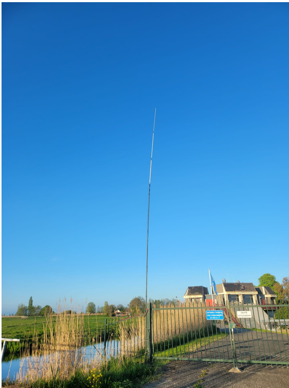
Met zo'n mastje denken bijna 30 km te overbruggen door het gemaal en Hilversum heen

Dan zal ik komende week onderzoeken of ik ook gewoon op een locatie kan gaan staan waar we wel gewoon te horen zijn zonder dat ik mensen eerst 10 km op pad moet sturen waarbij ze volledig op mijn appje moeten vertrouwen... Wat een logica! Ik ga denk ik als ik een keer in België ben in de haven van Antwerpen staan en als ze dan geen signaal hebben stuur ik een appje 'Gewoon richting Baarle Nassau rijden, dan komt het vanzelf goed!' ☺ Arno Arno Arno... wat ben je toch een amateur soms!