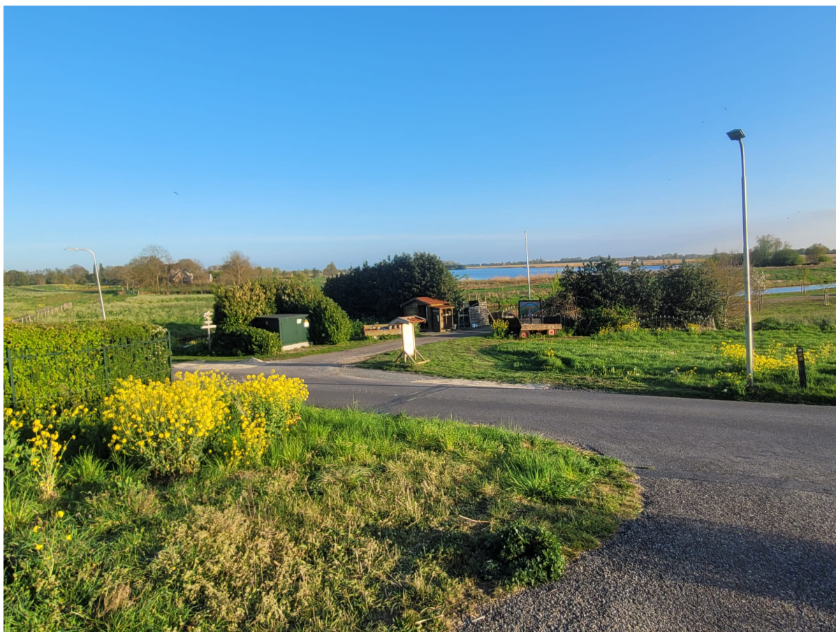
De buren van de Streekvos aan de overkant hebben een prachtig winkeltje met streekproducten