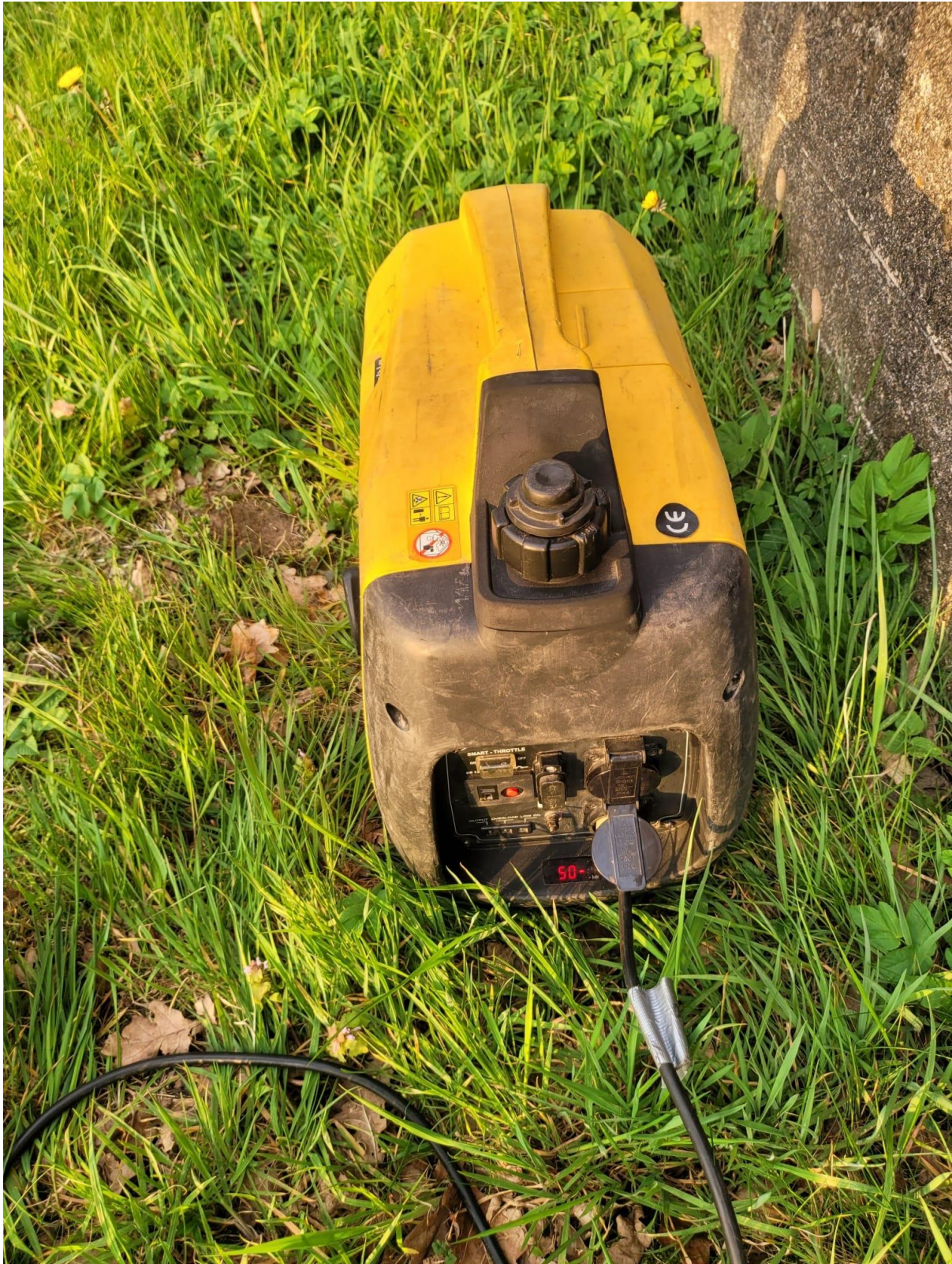
De ontluister boven op de vuldop was ik vergeten te openen, waardoor het ding moeilijk deed en meer dronk