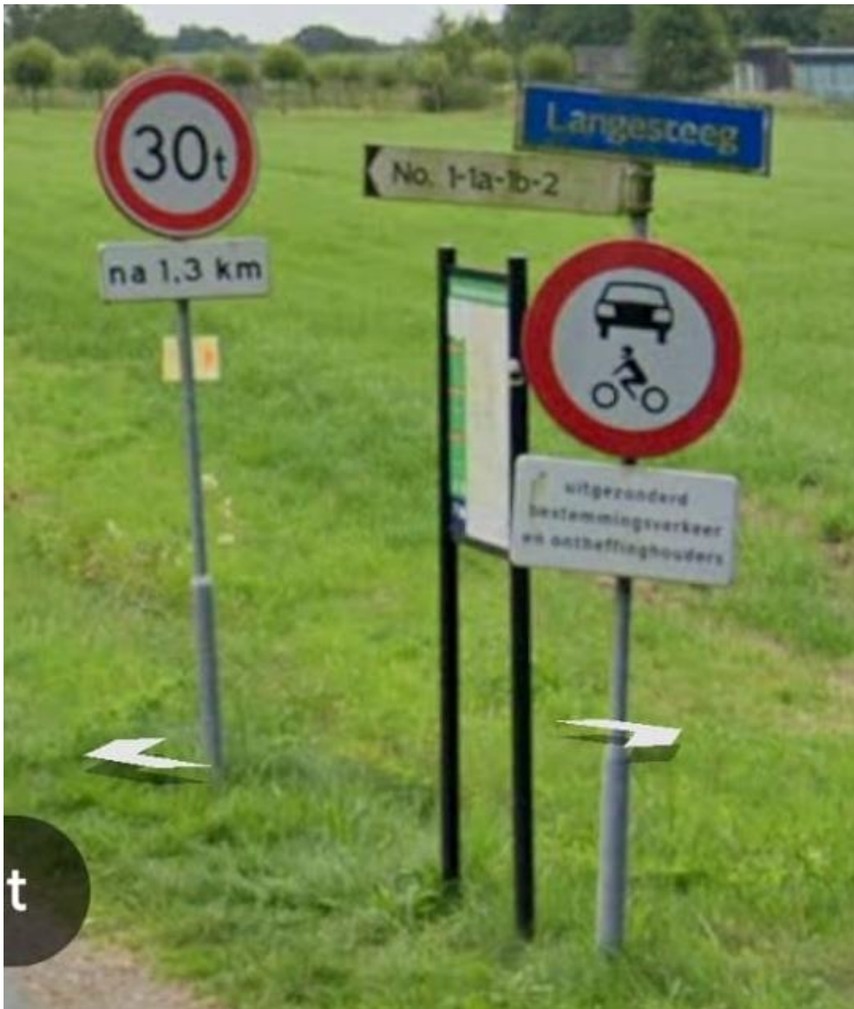
Ik zocht al naar de kanoboerderij waardoor ik dit bord helemaal gemist had (...)