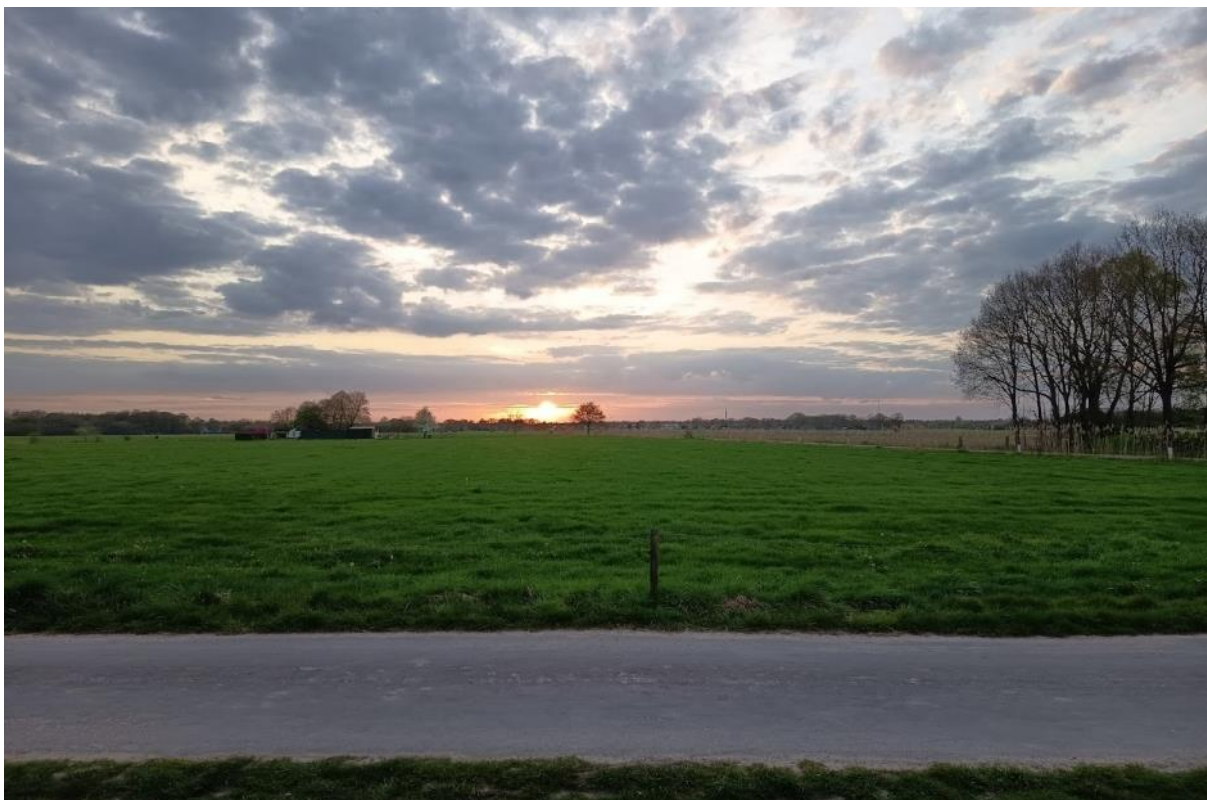
Zo beleefde Arno de zonsondergang in het westen vanaf de locatie van Streekvos 2.0 editie 16