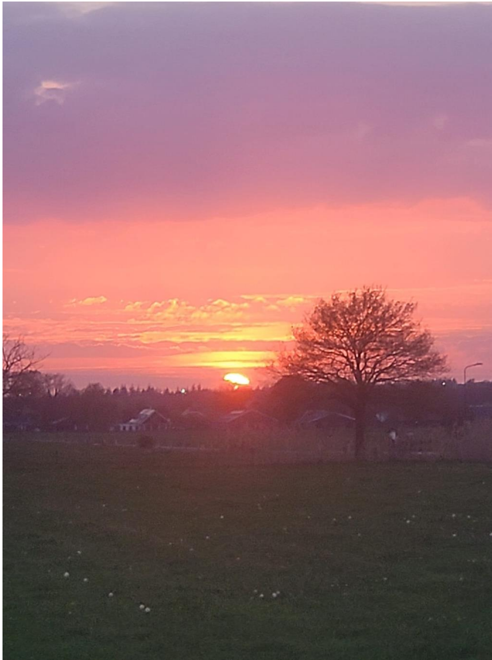
Ook deze schilderachtig mooie foto werd door Rob gemaakt

Ik was met stomheid geslagen en dat werd er niet beter op toen de mannelijke helft van team Stopcontact Sprinter aangaf dat aan het andere eind van de weg exact hetzelfde bord staat met hetzelfde onderschriftbord en de vrouwelijke helft van het team er aan toe voegde 'We waren bijna naar huis gegaan...' (ik zou het zelf ook doen als een vos illegaal staat).