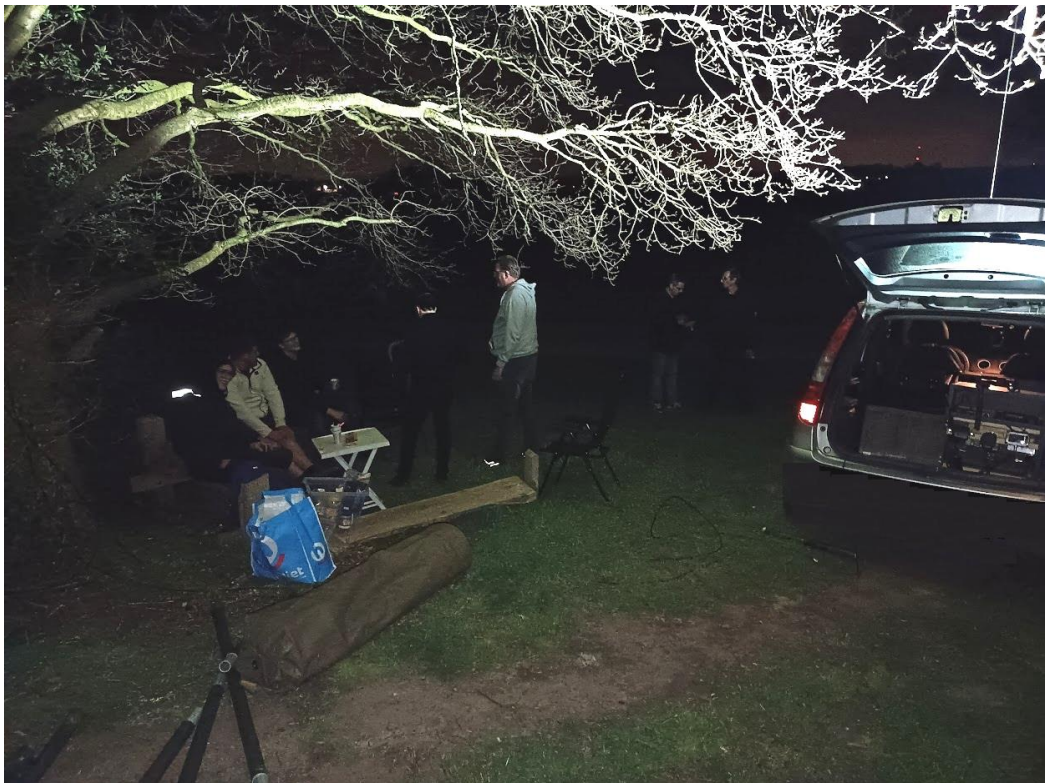
Als de schijnwerper in het donker op de zomereik wordt gezet ziet het er zo uit