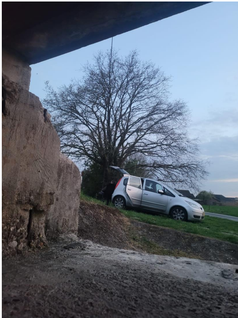
Alsof we ergens in het buitenland stonden