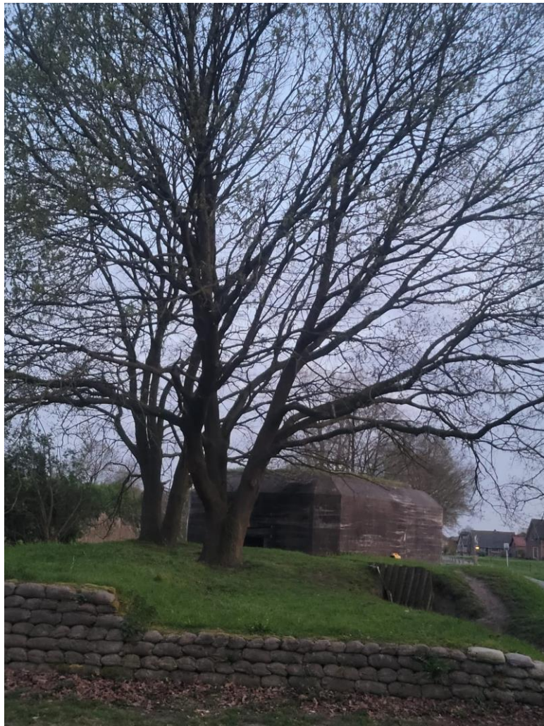
Zandzakken, bomen en een museumbunker met een (geel) aggregaat er naast