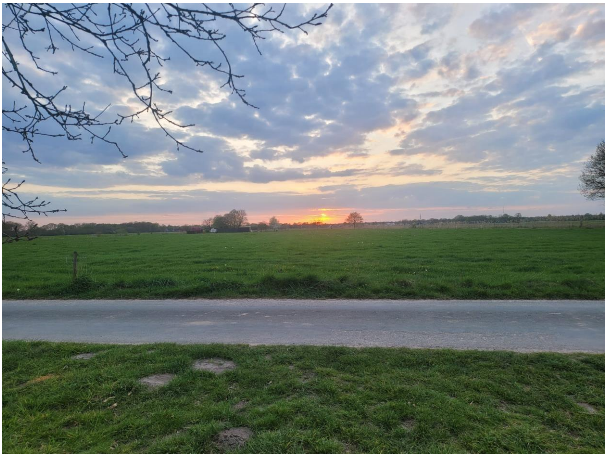
Zo maakte Rob de foto van de prachtige zonsondergang in het westen