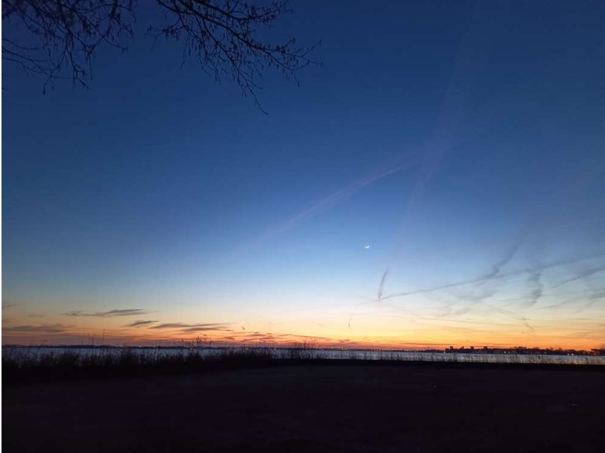
Het uitzicht was kilometers ver weg