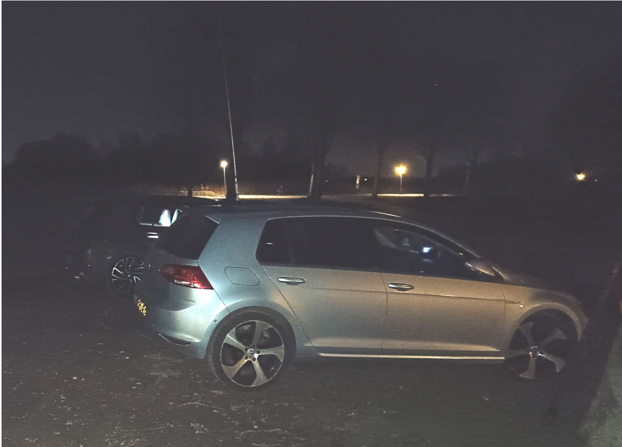
De luxe Volkswagen Golf diesel van Remco met de grote antenne er op

Maar wat doet Rob nog geen 5 minuten later?