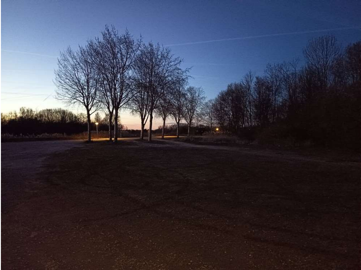
De wijde grindplaat waar zat auto's konden parkeren