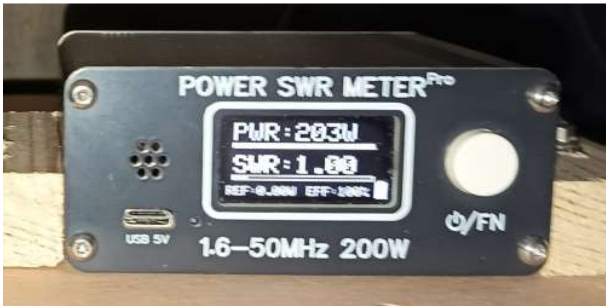
De beste SWR die je kunt hebben met zoveel zendvermogen

Na 2 doorgangen pakte ik zoals gewoonlijk de microfoon op en meldde mij als Streekvos Nederland®, SVN of gewoon 'De Streekvos'. Ik vertelde meteen even dat we niet meer zo ver stonden als vorige week in Zuid-Holland (dat was toen 50 km en nu was het maar 13 km tot het startpunt) en dat de plek ook makkelijker was. Maar dat laatste was niet helemaal waar hoor, alleen ging ik er vanuit dat deze plek al meerdere keren gebruikt was door andere radiovossen en dus voor een aantal deelnemers wel herkend zou worden als ze het signaal op hun meter zagen wanneer ze al wat in de buurt waren. Dat was er achteraf maar één, namelijk Danny Half Watje. Heel veel ruimte voor auto's, redelijk sfeervol, gezellig en met een fenomenaal uitzicht. Dat was deze geweldige plek (zie foto's).