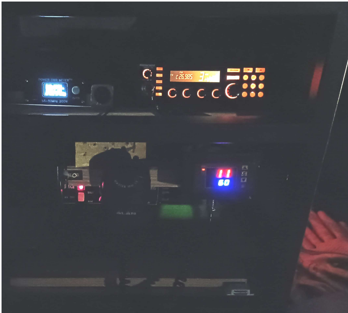
De spullen werkten goed in de eerste poging en de SWR was perfect

kunt er alleen maar beter van worden, want wij mensen realiseren ons vaak niet dat we meer op emoties dan op realisme leven. Dat geldt natuurlijk niet voor iedereen, maar de meesten hebben dit wel heb ik gemerkt. En daarvoor had ik er geen idee van bij mezelf, maar wist ook niet dat zoveel mensen hetzelfde probleem hadden (of nog hebben) wat ik had. Het is voor veel mensen ook geen makkelijk onderwerp als ze over de eigen zwakheden moeten praten en speciaal die mensen raad ik dit boekje aan.