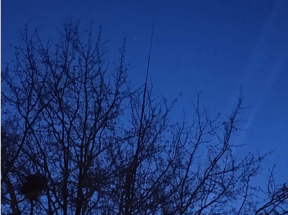
De antenne stond 16 meter hoog onder de sterren en een paaltje meer was achteraf beter geweest

nachtelijke kettingvos en stond toen moederziel alleen in een afgelegen stuk polder ergens in Nederland). Deelnemers of helpers (en Mitch is beiden) alleen achter laten op de radioslocatie vind ik sowieso persoonlijk ook moeilijk. Maar toen zag ik in mijn spiegel dat Mitch er aan kwam en toen reed hij aan mij aan tot het knooppunt Diemen (A1 - A9) waar onze wegen zich letterlijk scheidden. Ik volgde tot het einde de A1 om via de A10 Oost en de A8 terug te keren naar huis en Mitch draaide af door de A9 tunnel bij Amsterdam Zuidoost, om via de A9 en A4 ook naar zijn woonplaats terug te keren.