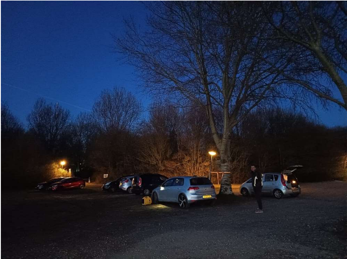
De sfeervolle Streekvos plek onder de grote Berk